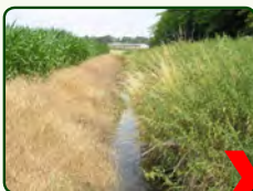
Spuit nooit de beekranden

Respecteer de wettelijke 1m spuitvrije zone t.o.v. niet te behandelen zones (bermen, aangrenzende percelen, wegen, grachten, enz.).