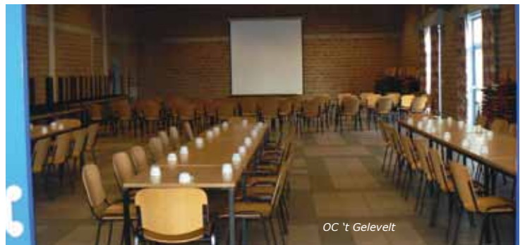
OC 't Geleveld