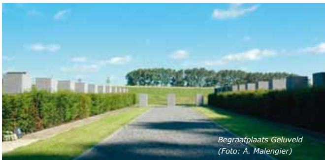
Begraafplaats Geluveld