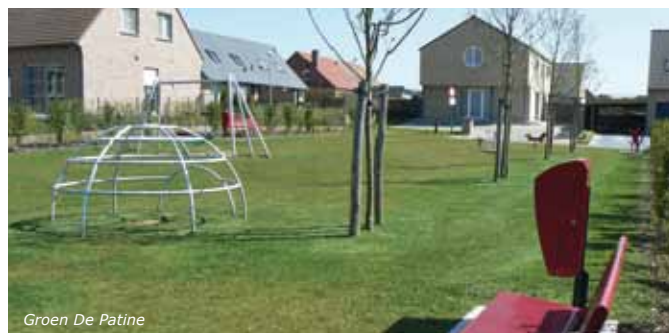
Groen De Patine