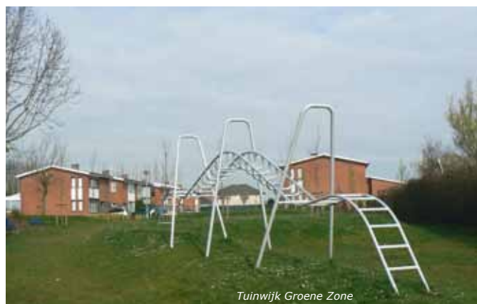
Tuinwijk Groene Zone