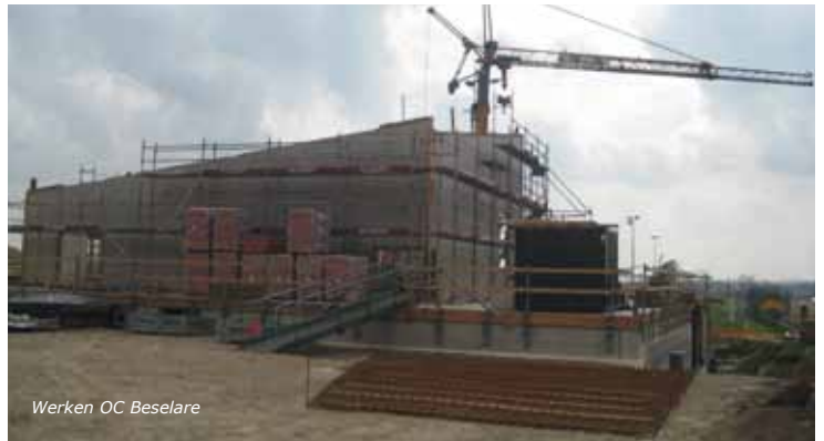
Werken OC Beselare

Als laatste is Beselare aan de beurt. Het nieuwe OC in Beselare dat geleidelijk aan vorm krijgt, wordt ingeplant bij de sporthal. Tijdens de infovergaderingen die liepen onder de noemer "Café OC" konden inwoners en gebruikers hun vragen en opmerkingen kwijt. Daarmee werd in de verdere uitwerking zoveel mogelijk rekening gehouden. De opening is voorzien voor het voorjaar 2013.