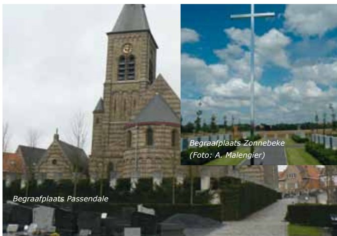
Begraafplaats Zonnebeke