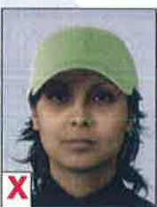
A. Hoofd bedekt