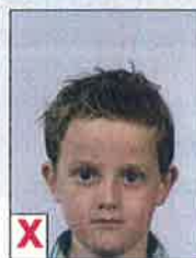
D. Hoofd te laag