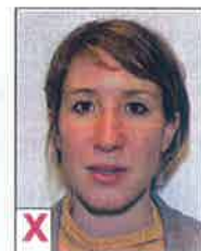
E. Mond niet gesloten