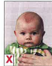
E. Zichtbare ondersteuning