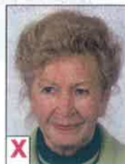
C. Niet recht in de camera kijken