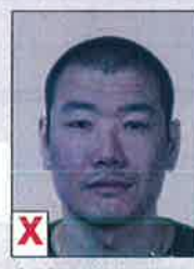
C. Onnatuurlijke weergave