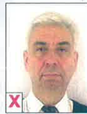
D. Onvoldoende contrast