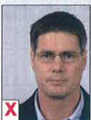
A. Niet gecentreerd