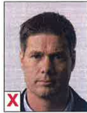
C. Schaduw gezicht