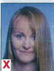
B. Gezicht niet volledig zichtbaar