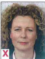
A. Geen neutrale blik