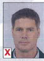
D. Onvoldoende contrast (flets)