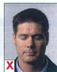
E. Ogen niet zichtbaar