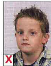
D. Opzij en schouders niet recht