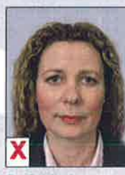
B. Optische vervorming