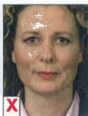
C. Hoofd te hoog