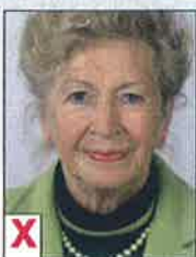
B. Hoofd te hoog