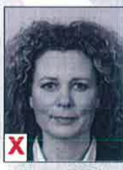
A. Zwart / Wit*