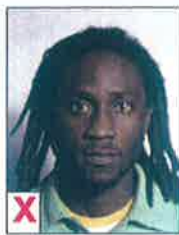
A. Niet egaal (schaduw)