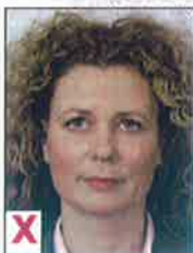
B. Niet recht in de camera kijken