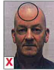
E. Reflectie en schaduw