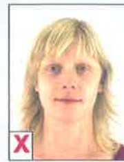
E. Onvoldoende contrast