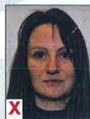
D. Gezicht en ogen niet volledig zichtbaar