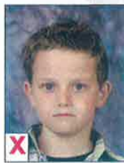
B. Niet eenkleurig