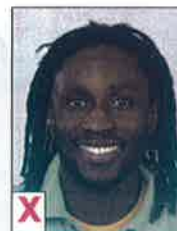
D. Mond open, tanden zichtbaar