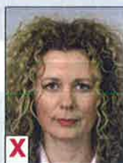
C. Gezicht niet volledig zichtbaar