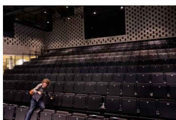
Theaterzaal met podium

Aantal plaatsen: 266 plaatsen + 18 extra