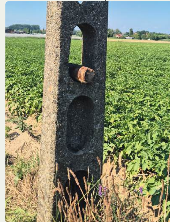
Plaats kleine projectielen die niet roken veilig in een opening van een EL-paal.

Meer weten? Politiezone Arro Ieper, 057 23 05 00