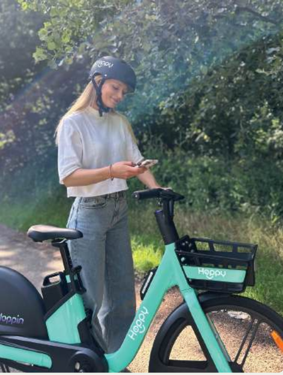
Gebruik een elektrische deelfiets vanaf het kerkplein in Zonnebeke.