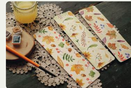
Maak je eigen boekenlegger op 2 of 8 oktober.