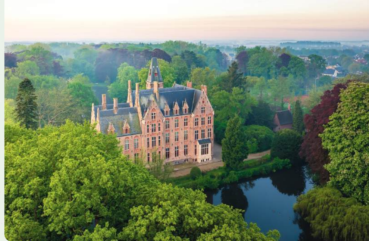
Via het dagboek van de kasteelheer kom je meer te weten over de oorlogsjaren van het kasteel van Loppem.