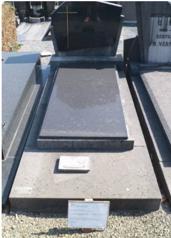
Staat er een bordje van de gemeente aan het graf? Dan vervalt de concessie binnen het jaar.

Merk je vanaf half oktober een bordje op aan het graf of de nis? Dan wil dit zeggen dat de graftermijn in 2026 afloopt. Deze melding gebeurt aan het graf zelf, aan de ingang van de begraafplaats en op www.zonnebeke.be . Om de graftermijn te verlengen, neem je voor 1 november 2026 contact op met de dienst burgerzaken. Verleng je de termijn niet, dan wordt de zerk van het graf weggenomen.