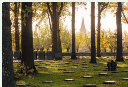
In Langemark ligt de Duitse militaire begraafplaats 'Studentenfriedhof'.