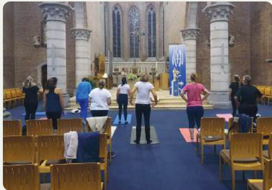
Vorig jaar kon je een sessie yoga volgen in de kerk.

Meer weten? Sociale dienst, 051 48 01 10, socialedienst@zonnebeke.be , www.zonnebeke.be/bewegentegenkanker25