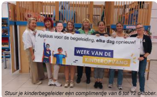
Stuur je kinderbegeleider een complimentje van 6 tot 12 oktober.

Op vrijdagavond 10 oktober zetten we alle onthaalouders en kinderbegeleiders uit onze gemeente op een leuke manier in de bloemetjes voor hun dagelijkse inzet! Stuur die week zelf een complimentje of een mooi ingekleurde tekening naar jouw kinderverzorger. Hou onze website, sociale media en nieuwsbrief in de gaten!